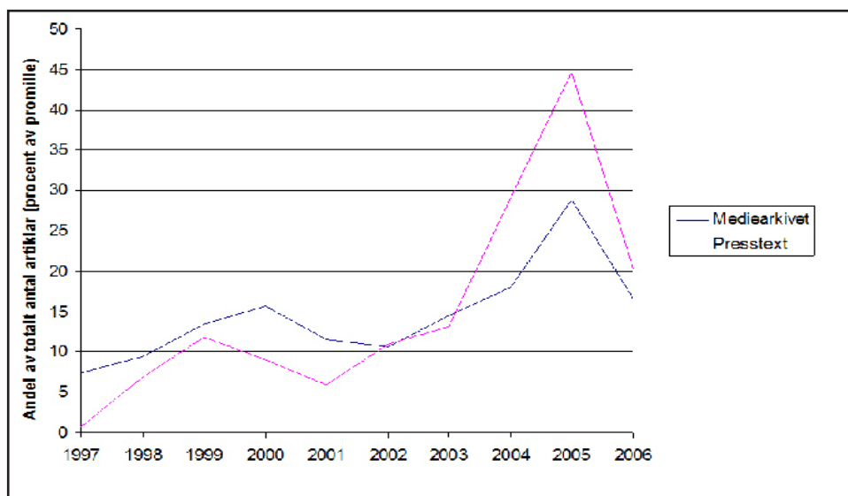
Diagram 2. Andel artiklar som fångas av sökorden genusforskare OR genusforskning OR genusvetenskap i databaserna Mediearkivet respektive Presstext, av det totala utbudet, åren 1997-2006

Bland de artiklar som finns i arkiven skrivs det allt mer om genusforskning och genusvetenskap. Samtidigt är andelen artiklar som fångas av sökorden oerhört liten. I Mediearkivet finns 840 934 artiklar år 2006. 139 artiklar passar in på sökorden. I Presstext finns 227 207 artiklar samma år. 46 artiklar fångas av sökorden. Men det ska ses mot bakgrund av att pressen, särskilt den lokala, skriver mestadels om brott, konflikter, olyckor och evenemang inom spridningsområdet. 9 Forskning, i synnerhet inom hum/sam-området 10 , är inte så framträdande som ämne.